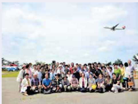
集合～！その時ちょうど！

去る7月13日、ボランティアどおし交流をしながら千葉県成田市に行ってきました。「航空科学博物館」では間近に飛行機が飛ぶ中、博物館職員の手順な説明に歓喜が沸き、隣の「空と大地の歴史館」では空港建設反対の運動を乗り越えながら開港した成田の深い歴史を改めて知る機会になりました。