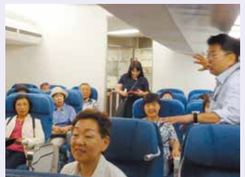
飛行機の座席に座り説明を聞く