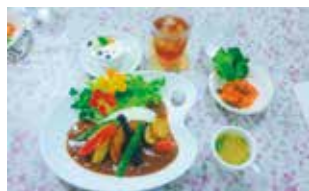
こんなランチいかがですか? (写真のランチはご予約のみ)