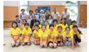
子どもヘルパーも一緒に ハイ・ポーズ!