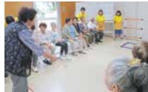
「ラダーゲッター」 高得点目指してそれー!

8月7・8日、合同交流会を行い、演奏やゲームで盛り上がりました。綿菓子やかき氷、木もれ陽特製カレーもおかわり続出!子どもヘルパーと共に楽しいひとときを過ごしました。