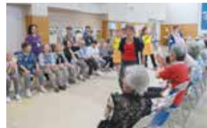
各教室合同チームで 大いに盛り上がる