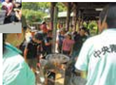
ハイゼックス炊飯