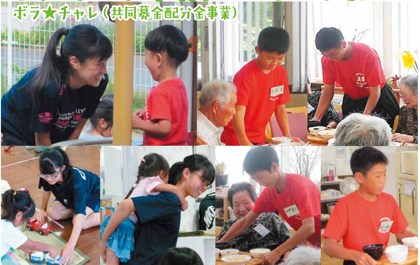
なかよく、たのしくあそぼうね(^o^)