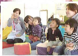
とびだす絵本に 親子で夢中です