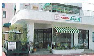
ランチ&カフェ「木もれ陽」