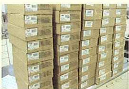
NPO法人 フードバンク茨城様