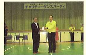
小美玉市ダンススポーツ連合会様