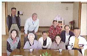
掃除後はゆったりお茶をいただきます

第三東宝自治区の集会所を会場として、福祉の話やフラダンス等のイベントと軽い昼食、茶話会が主な内容で実施しており、毎回提供する食事は、手作り感と季節感を心掛けています。