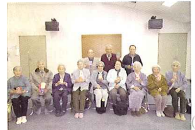
みのり…牛乳パックに和紙をはり、オリジナルのペン立てを作りました。