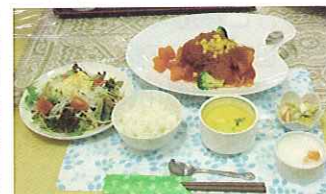
買い物バスツアー特別メニュー