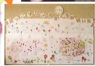
サロンに桜の花が 咲きました