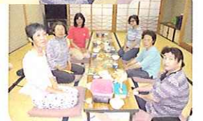
体操の後の“ほっ”とするひと時