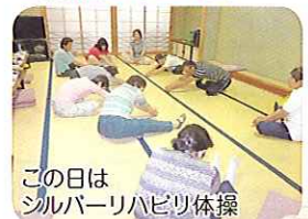
この日は シルバーリハビリ体操