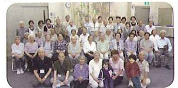
一年ぶりの再会でたくさんの笑顔に会えました