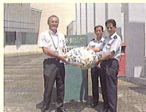
百里基地准曹会様