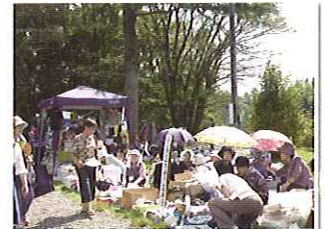
去年のバザー・フリーマーケットの様子

お申し込み・お問い合わせ 本所(玉里) ☎ 37-1551 (玉里保健福祉センター内)