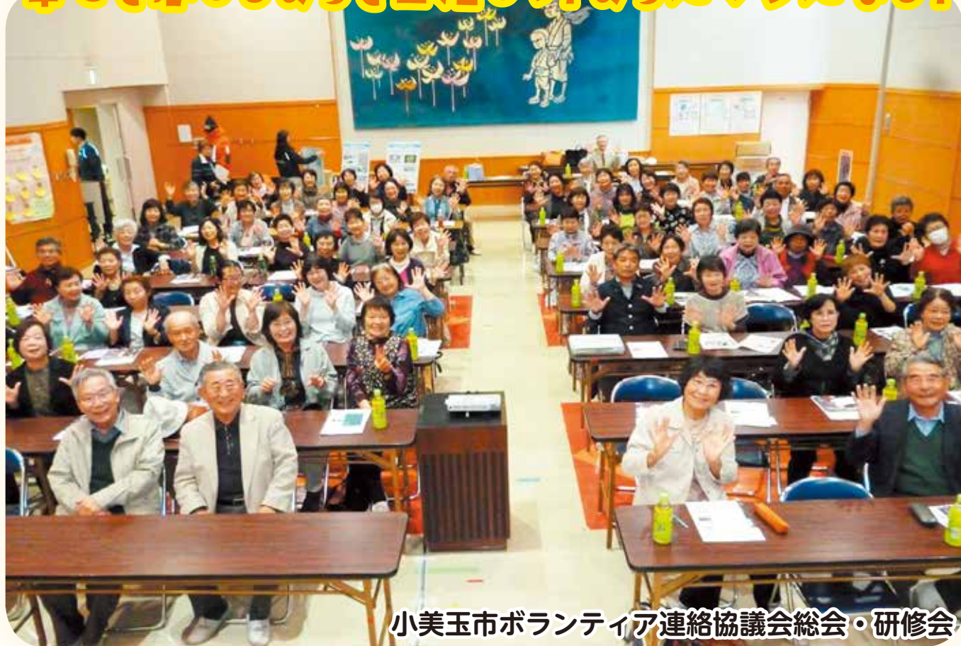
小美玉市ボランティア連絡協議会総会・研修会