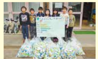
小美玉市立玉里東小学校様