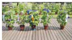
朝顔展示会「さらら」にて