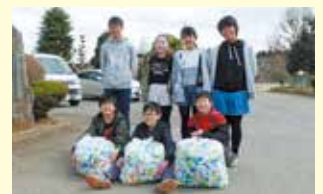
小美玉市立上吉影小学校様