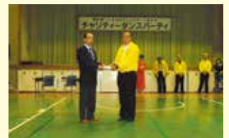
小美玉市ダンススポーツ連合会様