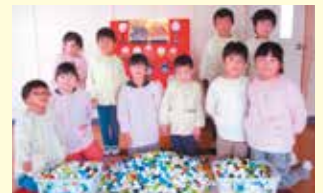
小美玉市立竹原幼稚園様