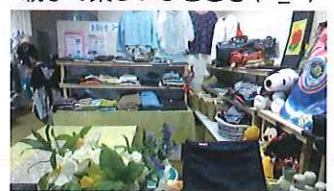
〈リサイクルコーナー〉 お気に入りの一品が見つかるかも♡