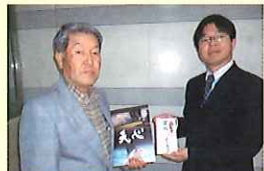
小美玉市文化協会様(左)