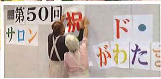
サロン・ド・おがわたまり運営ボランティア 「つくしんぼ」の皆さま