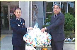
百里基地准書会様(左)