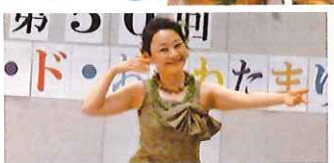
ハワイアン・フラ同好会の皆さま