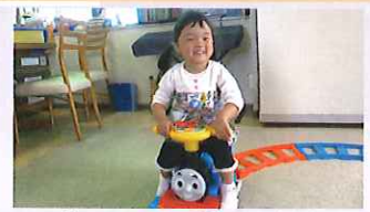
トーマスに乗れるよ!!

美野里ともいきプラザでは、リサイクル事業を展開しています。皆さまからいただいた、古着（乳幼児から大人まで）や食器などの日用品をお値打ち価格で販売しています。一見の価値ありです！ ※売上金は、地域福祉事業に活用しています。