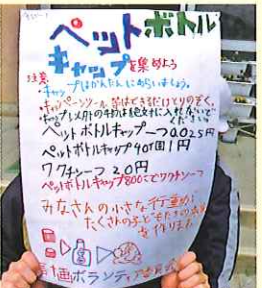
玉里小学校ボランティア委員会ポスター