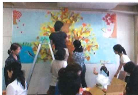
手作り大好きさん! あつまれ~!

お申し込み 本所(玉里) ☎37-1551 お問い合わせ 小川支所 ☎58-5102 美野里支所 ☎36-7330