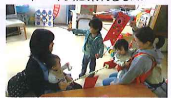
親子で楽しいひととき(*^_^*)