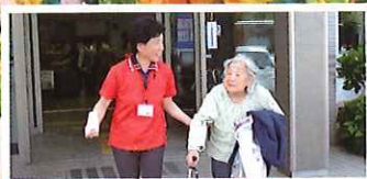
送迎ボランティアの皆さま