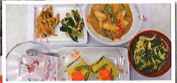
小美玉市食生活改善推進協議会の皆さま