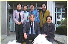
自民党女性局小川支部様