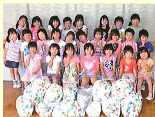
小美玉市立玉里幼稚園