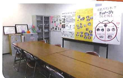
ボランティア室(美野里支所) (四季健康館内)