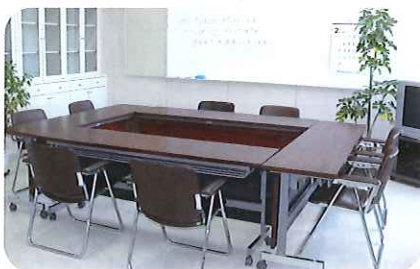
ボランティアセンター(本所) (玉里保健福祉センター内)