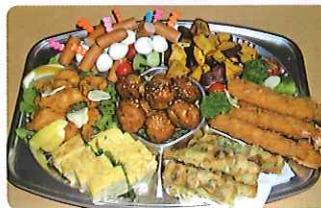
オードブル(子ども向け)