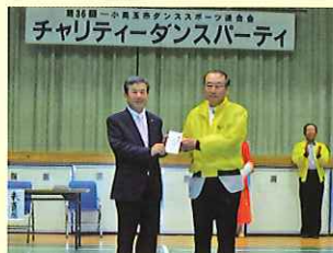
ダンススポーツ連合会様(右) ※前号掲載