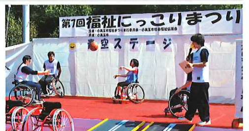
昨年度のカメラマンボランティアによる撮影

お申し込み お問い合わせ 本所(玉里) ☎37-1551 小川支所 ☎58-5102 美野里支所 ☎36-7330