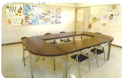
ボランティア室(小川支所) (小川保健相談センター内)