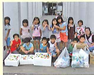
レゴ・パティ(ミーム保育園学童クラブ)様