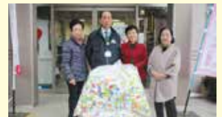
自民党女性局小川支部様