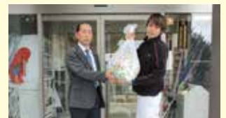
ヨコハマモールド(株)様