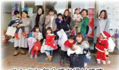
ルンルン気分でお帰ります。次回が待ちどおしいな。

初めての親子でも安心な子育てサロンです。夏にはプール、秋にはハロウィンパーティー、冬にはクリスマス会などを行っています。よかったら、一度来てみてください。