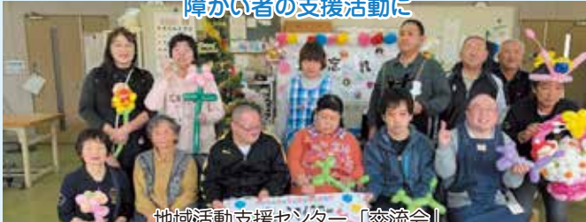
地域活動支援センター「交流会」