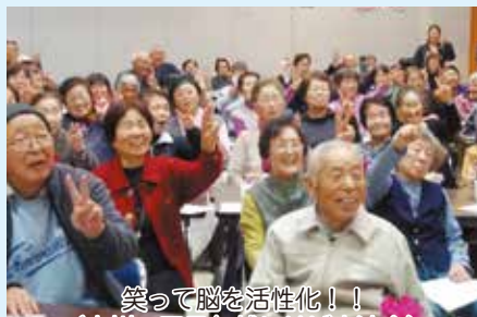
笑って脳を活性化！！ （小川・玉里年越しそば交流会）

小川・玉里地区（12月6・7日） …年越しそば交流会（86名・51名） 美野里地区（12月3・17日） …もちつき交流会（51・64名） が開催されました。