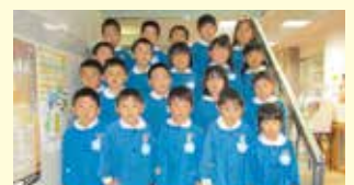
小美玉市立玉里幼稚園様