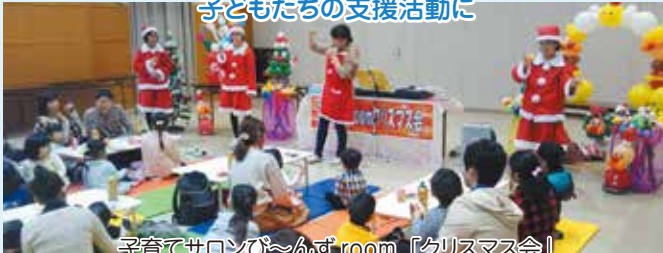
子育てサロンびんぼうroom「クリスマス会」

小川少年剣友会は現在16人が入団しています。今年度も歳末たすけあい募金を活用し、百里サンハウスさんへならせ餅の飾り付けが訪問させていただきました。この訪問は30年近くに渡って続けてきた行事です。今年は感性症の影響で玄米でのお渡しのみとなりましたが、無病息災と五穀豊穡を願うこの行事に大変喜んでいただくことができました。 小川少年剣友会様より