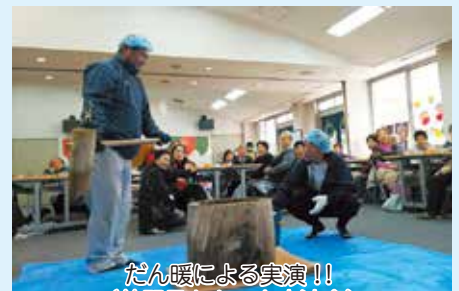
だん暖による実演！！ （美野里もちつき交流会）