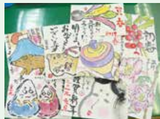
絵手紙同好会の皆様より

絵手紙同好会と玉里中学校の生徒さんが、高齢者の皆様へと心温まる年賀状を書いてくださいました。本会をとおして皆さまへお届けいたしました。