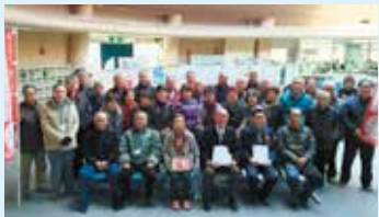
一人ひとり手渡しでお届けいたしました

12月27・28日民生委員さんやボランティアさんのご協力により、市内662名の対象者におせちセットをお配りいたしました。