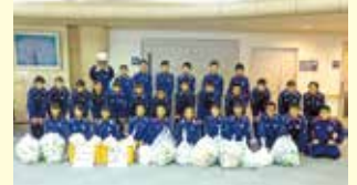
小美玉市立美野里中学校様