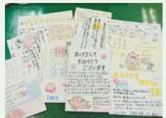
玉里中学校の皆様より