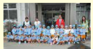
ルンビニー学園幼稚園様