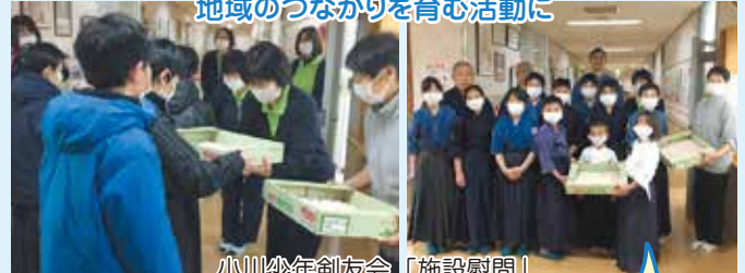
小川少年剣友会「施設慰問」