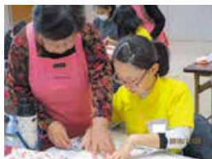
こうやって作るのよ(^^)

「おじいちゃん、こんにちは!」「おばあちゃん、来たよ〜」玄関先に元気に響くかわいい声。満面の笑みで迎える高齢者。市内小学校4〜5年生61名が子どもヘルパーとして活躍しています。高齢者のお宅に訪問し、話し相手やボランティアなどをして、「高齢者を地域みんなで支え合う地域のきずなづくり」を推進しています。11月に、消費生活の会の皆さんのご指導のもと、牛乳パックを使ったキャンディーボックスを心を込めて作りました。『いつまでもお元気で』『また、遊びに行くね』など心温まるメッセージを添えて高齢者にプレゼントしました。