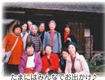
たまにはみんなでお出かけ♪

「ほっとする! 楽しい! こんなサロンあってよかった!」になるように、このサロン名にしました。毎月1回、おしゃべりしたり、お食事したり、歌ったり、体操したり、学んだり...。どなたでも参加できます。あなたも仲間に入りませんか? お気軽にお電話ください。