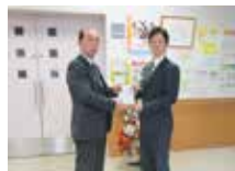
クレハ労働組合様

(株)前川林業 (株)新堀自動車 アツちゃん弁当美野里店 アイグル(株)しん美野里店 (有)カタクラ商事 栗原紙材(株)美野里事業所 (株)一昇金属 丸茂産業(株) そば処たむら (株)内田化工 勇ちゃん食堂 三英電業(株)茨城営業所 白帆ロジテム(株) ひょうたん美術館 イトウ製菓(株)水戸工場 茨城マイカー販売(株) (株)ハタヤマモータープール 美野里病院 (株)ゆにろーず茨城T.S店 大陽日酸エネルギー関東水戸支店 (株)ハーベストジャパン いばらきコープ物流センター (株)鶴町製作所 森永牛乳配合(株) 珍来 美野里店 トヨタローラ新茨城美野里店 茨城ダイハツ販売(株) トベツテック/パセーター美野里店 トヨタレンタリース茨城(株) トヨタホーム茨城(株) 茨城トヨタ自動車(株)美野里店 君山自動車(株) 茨城トヨペットUカー6号美野里店 三美運輸(株) (株)協同企業 交易食品(株)茨城工場 JA全農ミートフーズ(株) DRPネットワーク(株) アジア熱処理技術研(株)茨城工場 大和田建材 トヨタL&F茨城(株) (株)おがわ (株)セントラスエステート 美野里農事試験場 聖書学院 飯塚運輸(有) (有)七福 羽鳥駅前ハイヤー(有) (株)茨城ハウジング 株)川又商会 (株)柳川探種研究所 サイクルショップナガイ 真家電気 羽鳥デンタルクリニック (有)岩本石材 エフ.アイトラベル 古谷美容室 メグミ (有)タヤマ (有)梅屋百貨店 (株)クボタ総建 (株)スズヤ 森ガラス