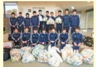
小美玉市立小川南中学校様