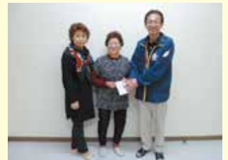
小美玉市すみれカラオケ様