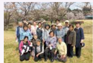
お花見に行きました