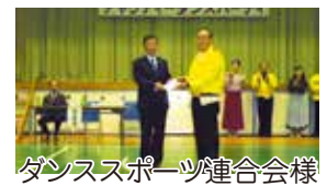
ダンススポーツ連合会様