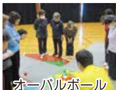
オーバールボール

お問い合わせ 茨城わくわくセンター 029-243-8989 (シニアマスター係)