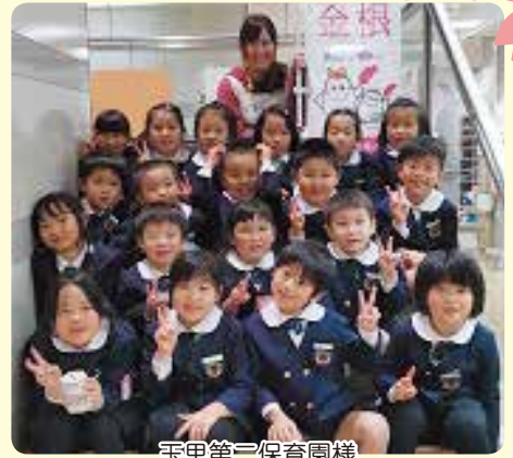
玉里第三保育園様