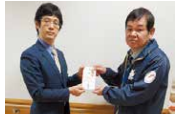
クレハ労働組合様(左)