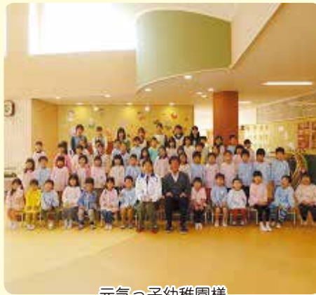
元気っ子幼稚園様