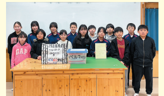
小美玉市立小川南小学校 様