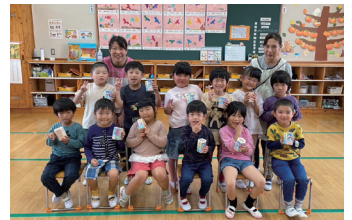
小美玉市立よつば幼稚園 様