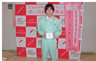
(株)フジクラハイオプト 様