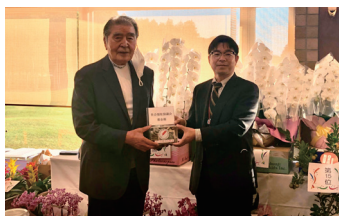
小美玉市商工会ゴルフコンペ 様

※個人(2,001円以上)や企業が共同募金に寄付した場合、税制上の優遇措置が受けられます。