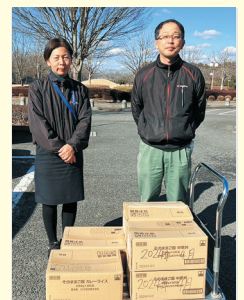
横浜ゴム(株)茨城工場 様