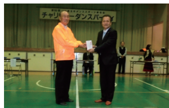
小美玉市ダンススポーツ連合会 様