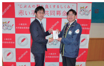
クレハ労働組合 様