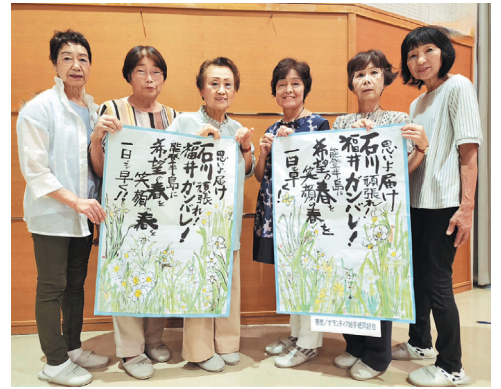
— 絵手紙同好会 —